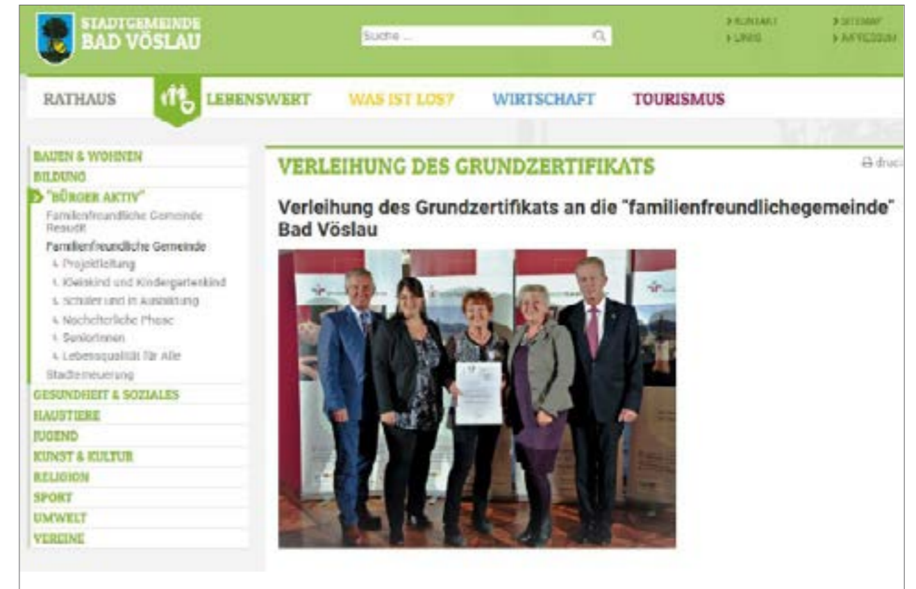
Gütezeichen und Zertifikat auf der Webseite - Beispiel Stadtgemeinde Bad Vöslau (NÖ)