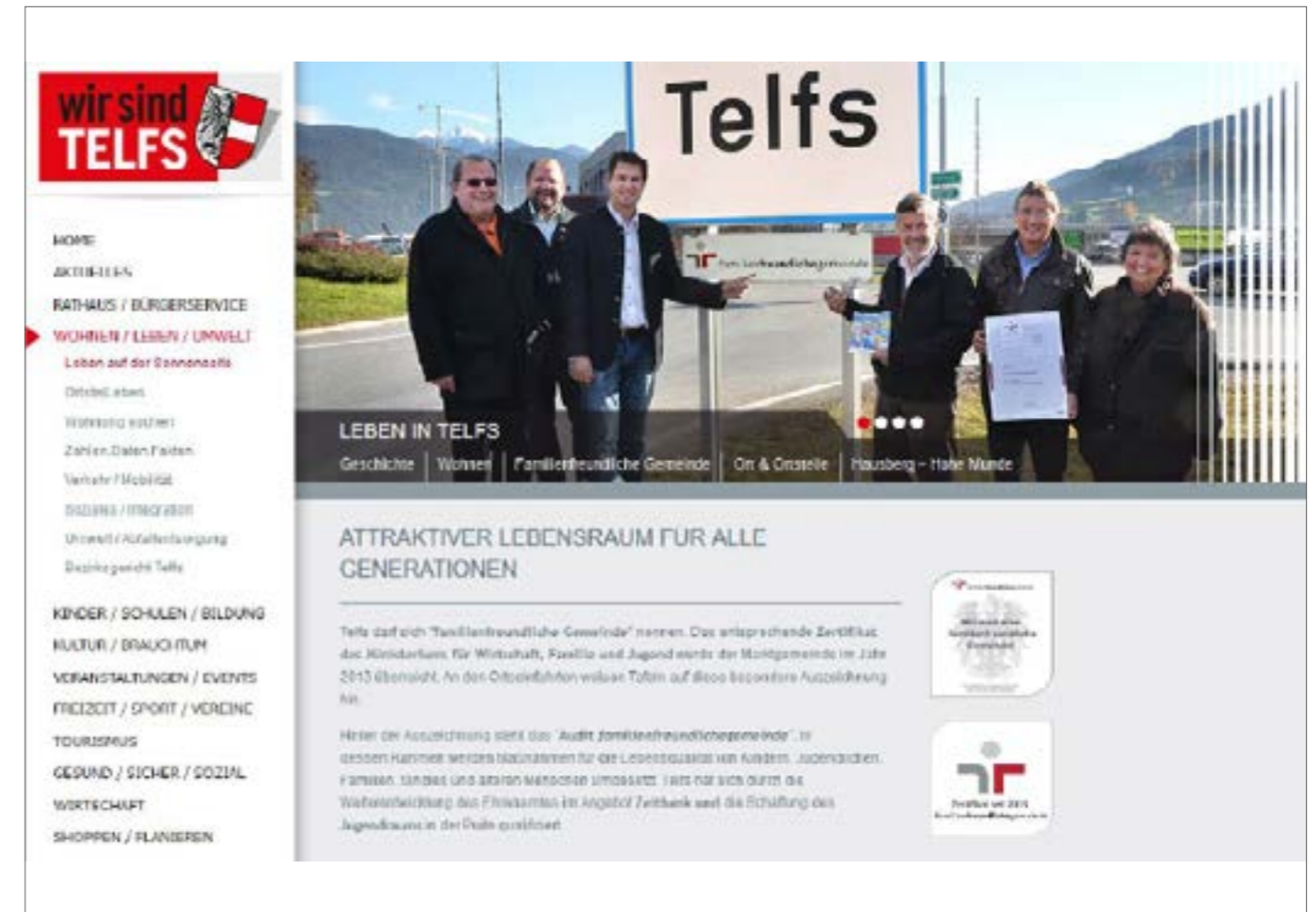
Gütezeichen auf der Webseite - Beispiel Gemeinde Telfs (Tirol)