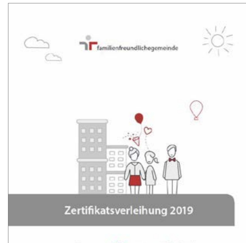
Beispiel: Festbroschüre zur Zertifikatsverleihung familienfreundlichegemeinde

Sie steht am Tag nach der Verleihung auch auf der Webseite der Familie & Beruf Management GmbH zum Download zu Verfügung.