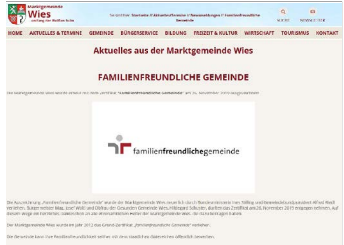
Logo auf der Webseite - Beispiel Marktgemeinde Wies (Stmk)