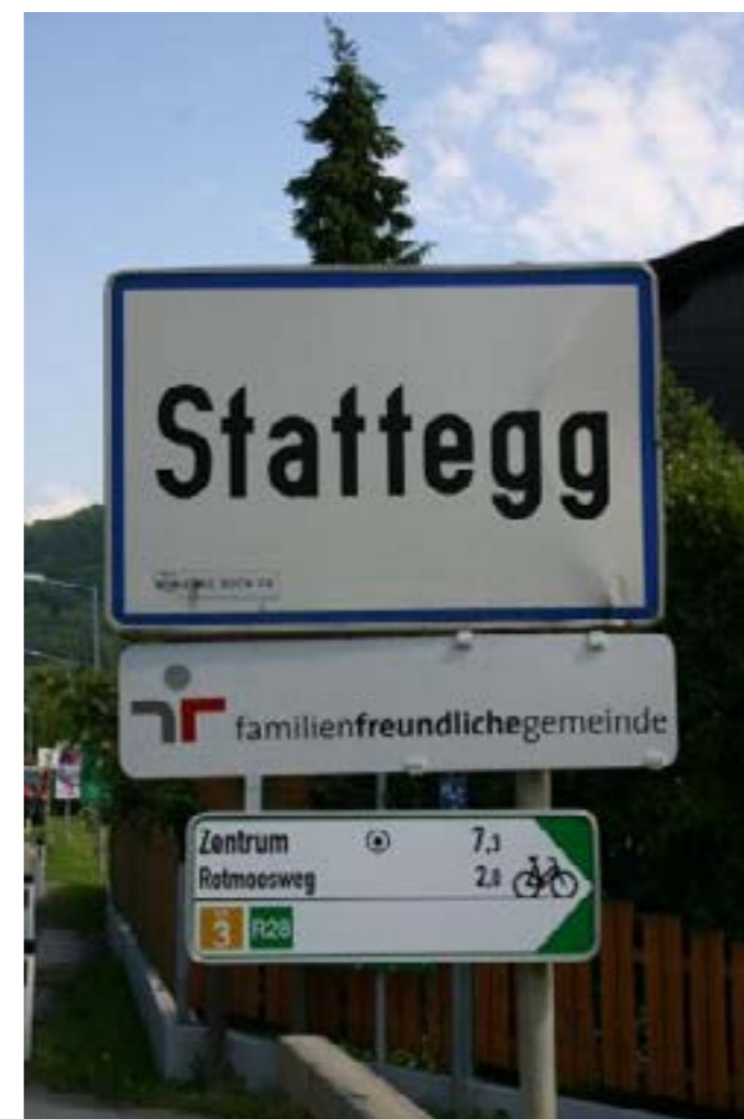
Anbringung der Ortstafel - Beispiel Gemeinde Stattegg (Stmk)

Für die ordnungsgemäße Anbringung der Ortstafeln sind die Gemeinden eigenständig verantwortlich. Bitte beachten Sie dazu auch die in Ihrem Bundesland geltenden Regelungen dazu.