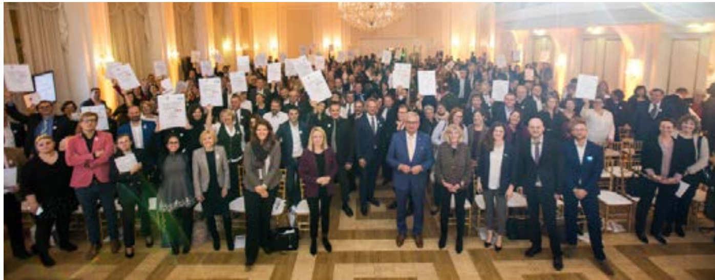
Zertifikatsverleihung familienfreundlichegemeinde 2019

Bei der jährlichen Zertifikatsverleihung werden die auditierten Gemeinden/Regionen mit dem jeweiligen Zertifikat und staatlichen Gütezeichen ausgezeichnet.