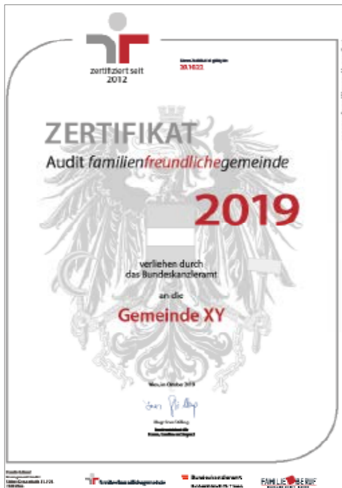
Zertifikat familienfreundliche Gemeinde

Die vorliegende Grafik darf nicht verändert werden. D.h. dass beispielsweise keine Logos, Wappen oder Aufschriften hinzugefügt werden dürfen. Bei Fragen wenden Sie sich bitte an die Familie & Beruf Management GmbH (Kontakt siehe Seite 18).